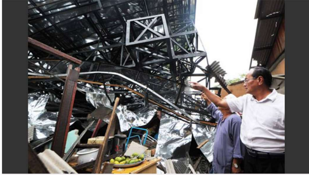
Angin kencang menyebabkan papan iklan terletak berhampiran rumah bersebelahan Lebuhraya Utara-Selatan, tumbang.